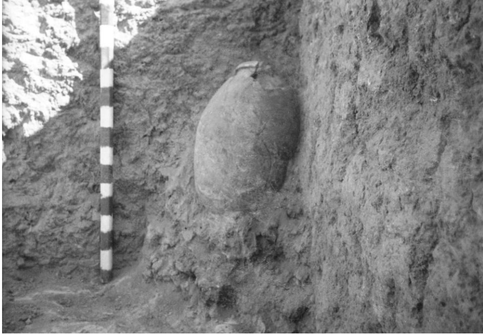
صوره ٣ - تل ورش - الطبقة الثانية - الدور الثاني - جرة الرقم