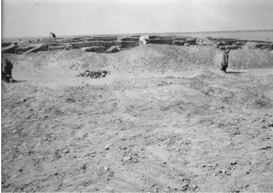
صوره ١ - تل ورش - الطبقة الثانية - الدور الثاني