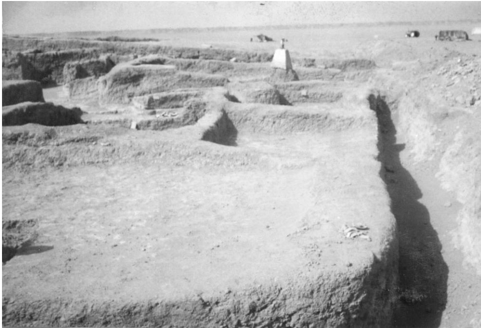
صوره ٢ - تل ورش - الطبقة الثانية - الدور الاول