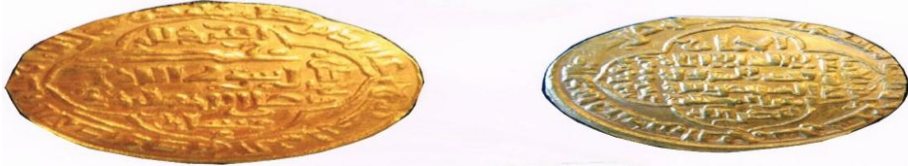
شكل ( 2 )