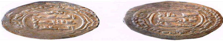
شكل ( 3 )