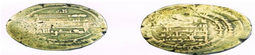
شكل ( 2 )