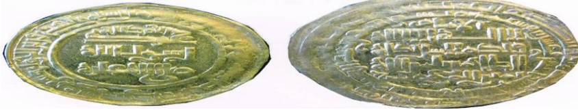
شكل ( 1 )