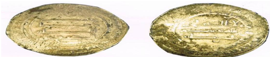
شكل ( 1 )