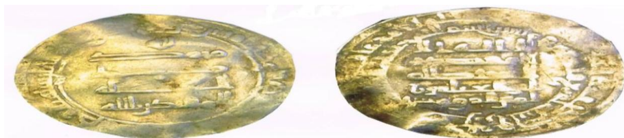
شكل ( 3 )