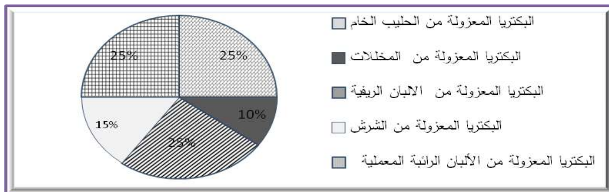
شكل(1): النسب المئوية لعزلات بكتريا Lactobacillus موزعة حسب مصادر عزلها .

الحليب الخام والمخللات والألبان الريفية والشرش والألبان الرائبية المعملية على التوالي بنسب (25 و 15 و 25 و 10 و 25%) من مجموع العزلات المتحصل عليها، على التوالي أيضاً (شكل 1).