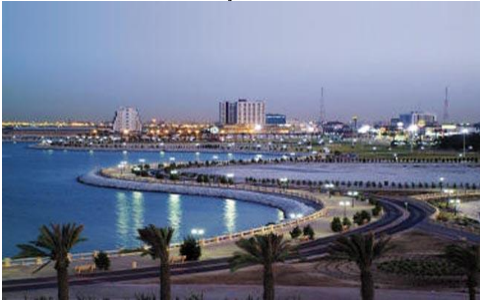
شاطئ الغروب في مدينة الخبر