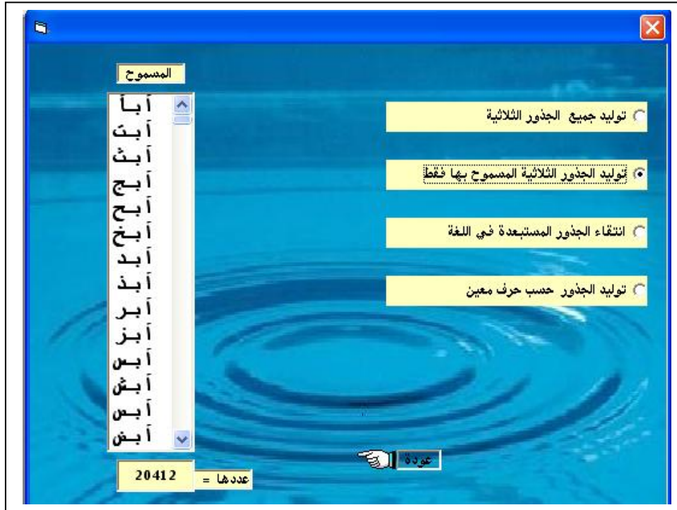
الشكل (٥): توليد الجذور المسموح بها فقط في اللغة العربية وعددها