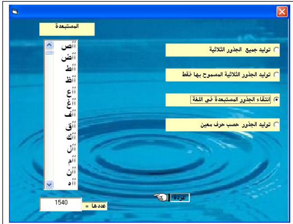
الشكل (٦): يبين توليد الجذور الثلاثية المستبعدة وعددها