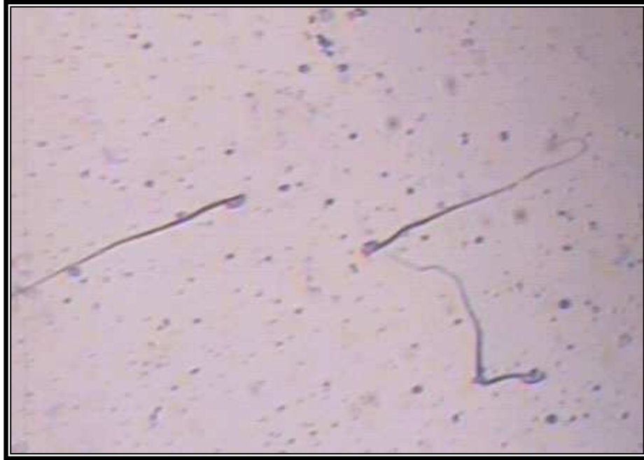
صورة (4): تشوهات النطف (فقدان كلاب رأس النطفة)