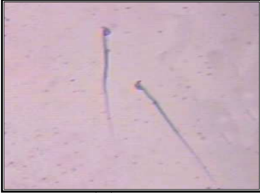
صورة (1): نطفة سوية