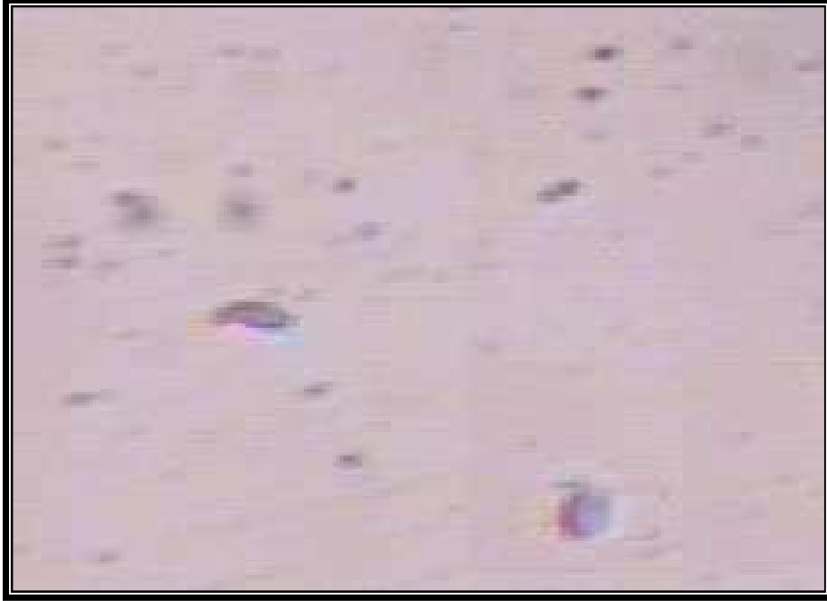
صورة (3): تشوهات النطف (فقدان ذيل النطفة)