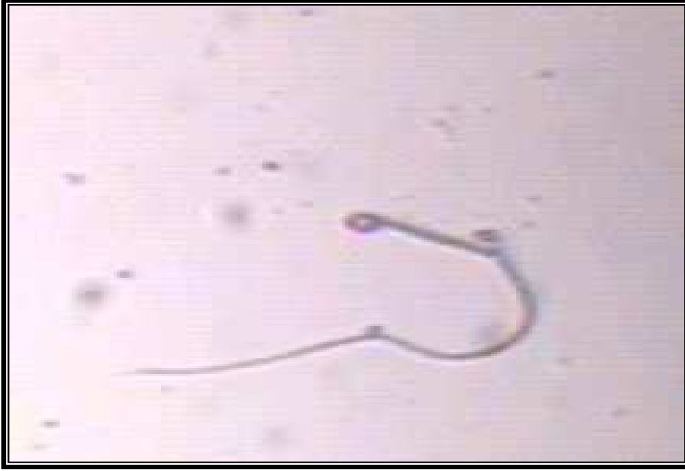
صورة (5): تشوهات النطف (الرأس كروي)