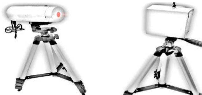
شكل (١) يوضح جهاز العدو المتعرج ( ٥٠ ) م مكوكي

٣-٢-٣ اختبار الاستناد الامامي (شناو صدر) :