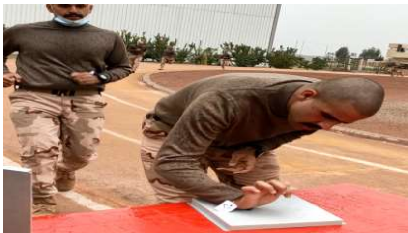
شكل (٥) يوضح خط النهاية للمختبر وطريقة المجس المثبت بمعصم اليد للوح الالكتروني

، وعند اشارة البدء يقوم المختبر بالجري من خط البداية لمسافة (٢٤٠٠) متر الى خط النهاية ، ويود ان يشير الباحثان ان احتساب الزمن يتم الكترونياً من خلال ربط مجس يربط على معصم المختبر وهذا المجس مخصص للمختبر من خلال برمجته لقياس الزمن والذي يبدأ عند صافرة البدء وينتهي عندما يلامس المختبر المجس بلوح الكتروني متحسس عند خط النهاية (شكل ٥) ، والمربوط بجهاز حاسوب يعطي زمن كل مختبر .