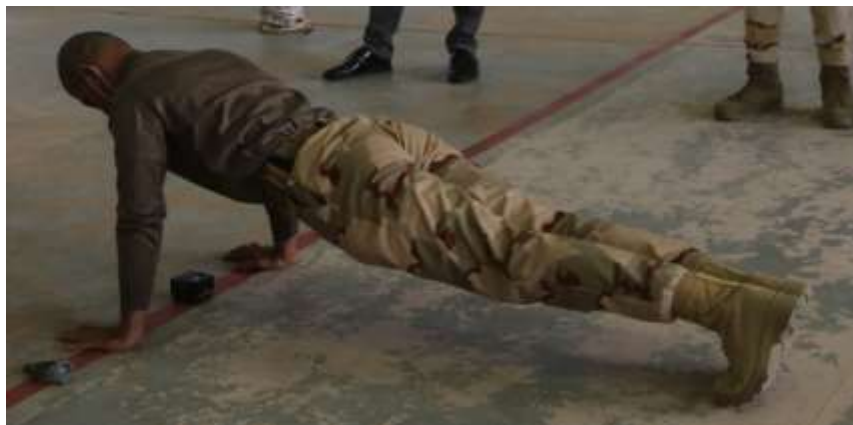
شكل (٣) يوضح وضع جهاز (WH) في اختبار الاستناد الامامي