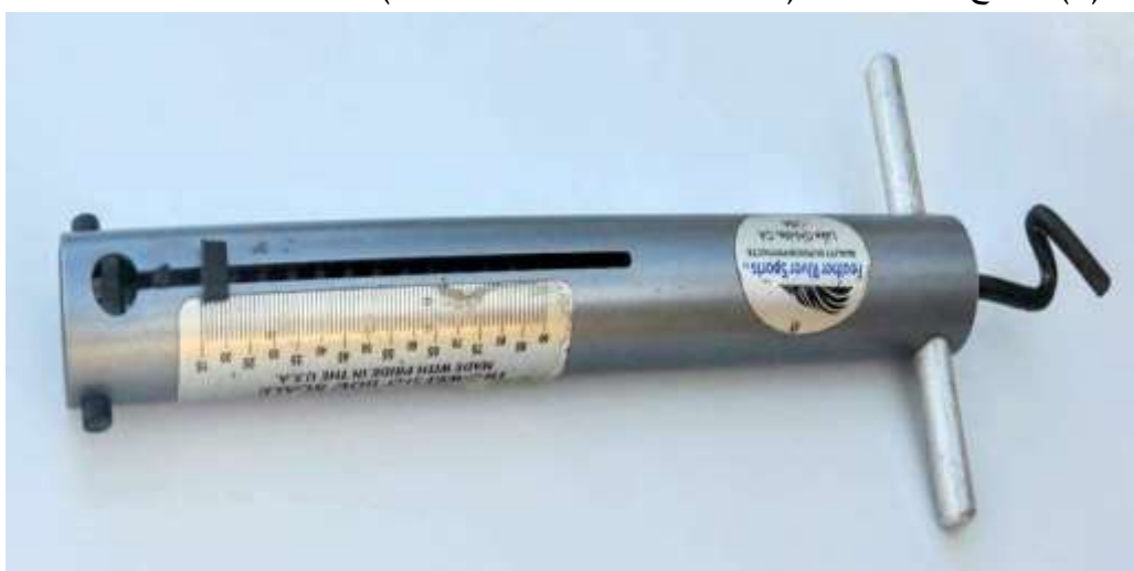
الشكل (١) يوضح جهاز قياس قوة الشد (السحب)