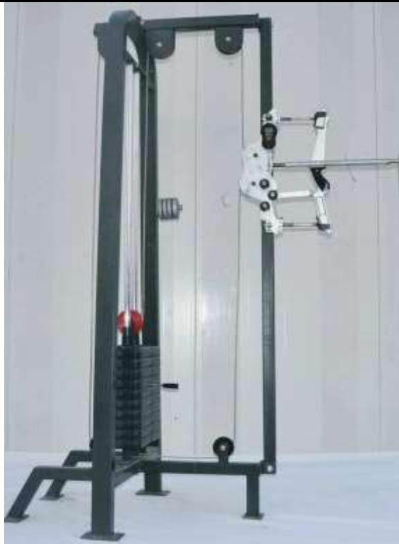
الشكل (٢) يوضح جهاز قياس قوة الدفع