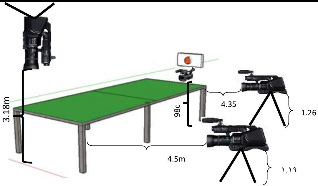
الشكل (٢) يوضح مواقع الات التصوير الأربع