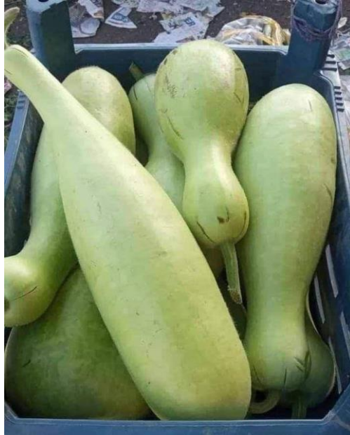
صورة لنموذج قرع سلاحي الذي كان يستخدم في أكلة الشاروقية عند اهل الموصل

أخبار عين كبريت في الصحف المحلية الموصلية جمع واعداد عامر سالم حساني من صفحته على الفيس بوك