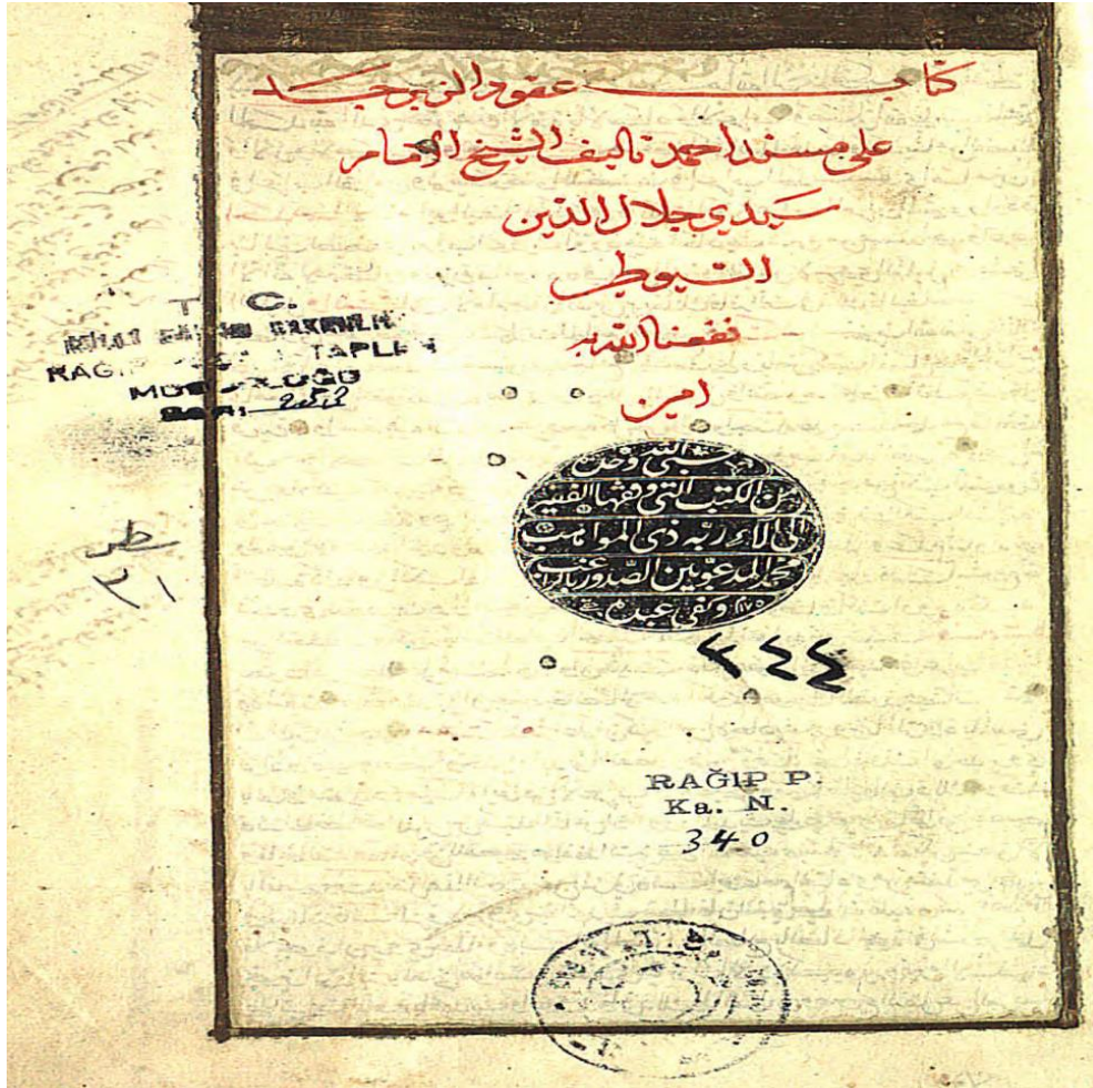
صفحة العنوان من مخطوطة مكتبة راغب باشا لكتاب (عقود الزبرجد في إعراب الحديث النبوي)