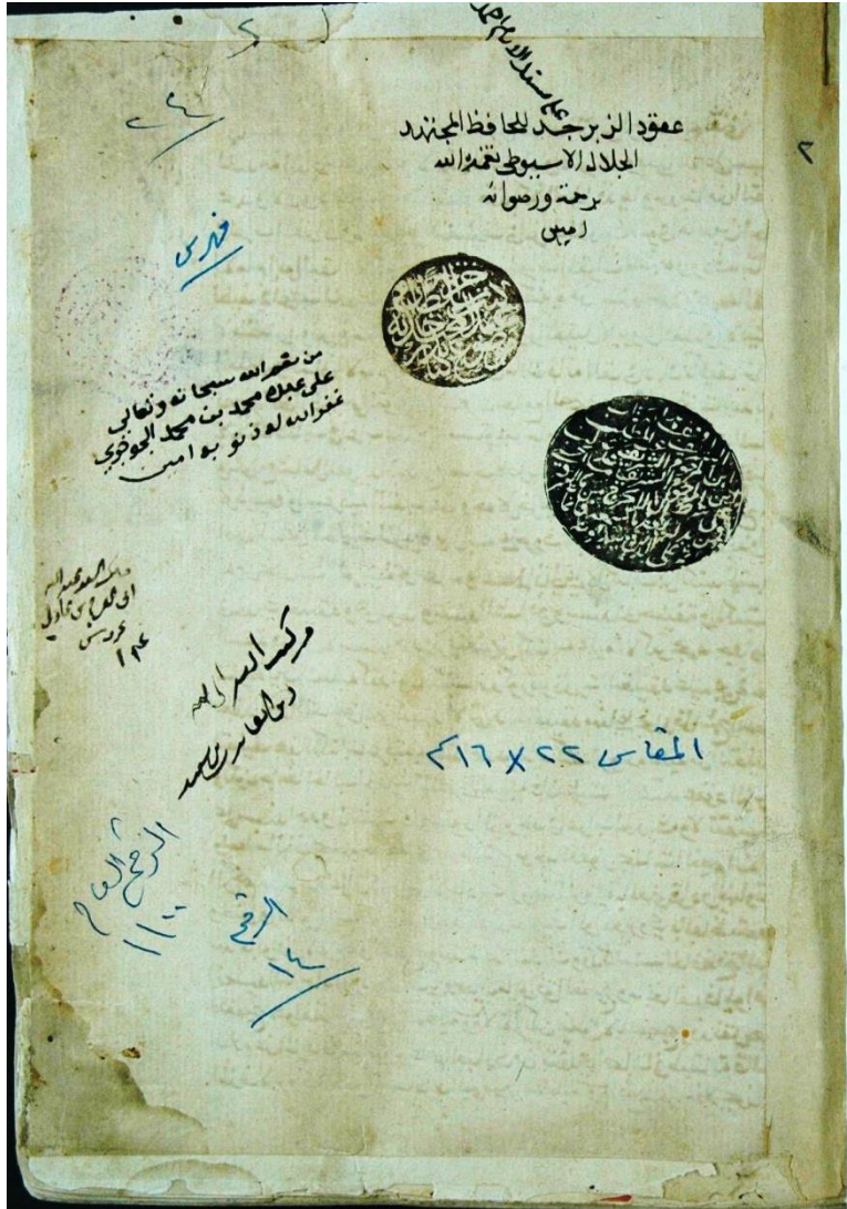
صفحة العنوان من مخطوطة مكتبة الحرم المكي لكتاب (عقود الزبرجد في إعراب الحديث النبوي)