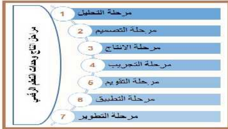
الشكل (١) مراحل إنتاج وحدات التعلم الرقمي