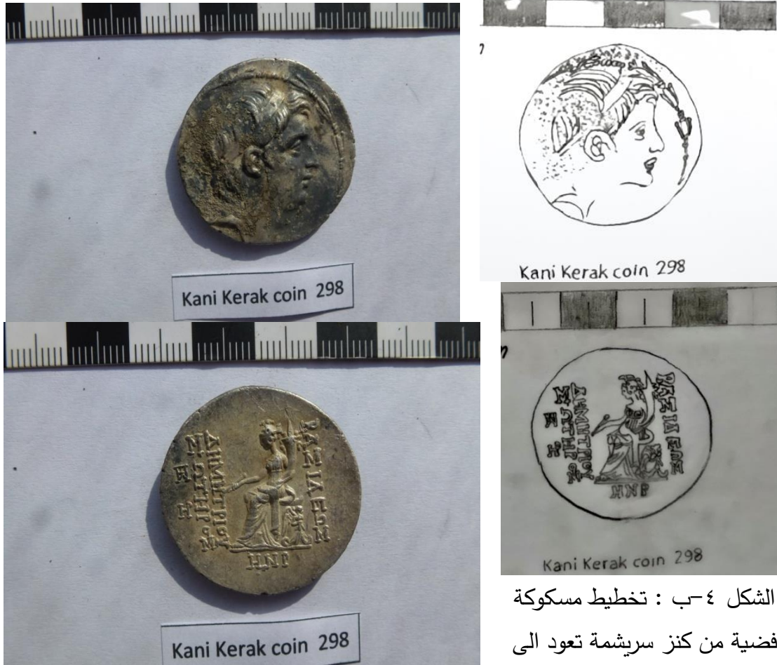
الشكل ٤-أ: مسكوكة فضية من كنز سریشمة تعود الى الملك ديميتريوس، مع لقب سوتر.