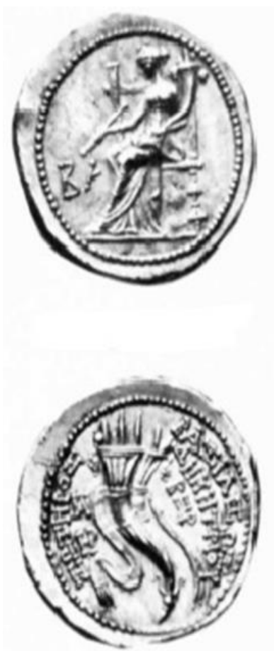
الشكل 2: مسكوكة الملك ديميتريوس، من نوع ضرب خاص، نرى على وجه المسكوكة الإلهة تايخي جالسة على عرشها، و نرى على ظهر المسكوكة قرن الخصب. (مأخوذة عن: Houghton, Ibid, Part II, vol.2, 2008, pl.13, fig.1630.2a-AV)