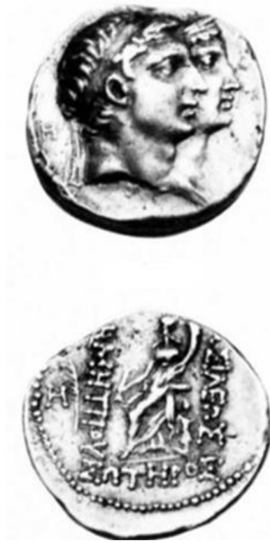
الشكل ١: مسكوكة الملك ديميتريوس و زوجته لاوديكي. (مأخوذة عن: Houghton, L., Seleucid Coins, Part II, vol.2, 2008, pl.16, fig. 1689.2).