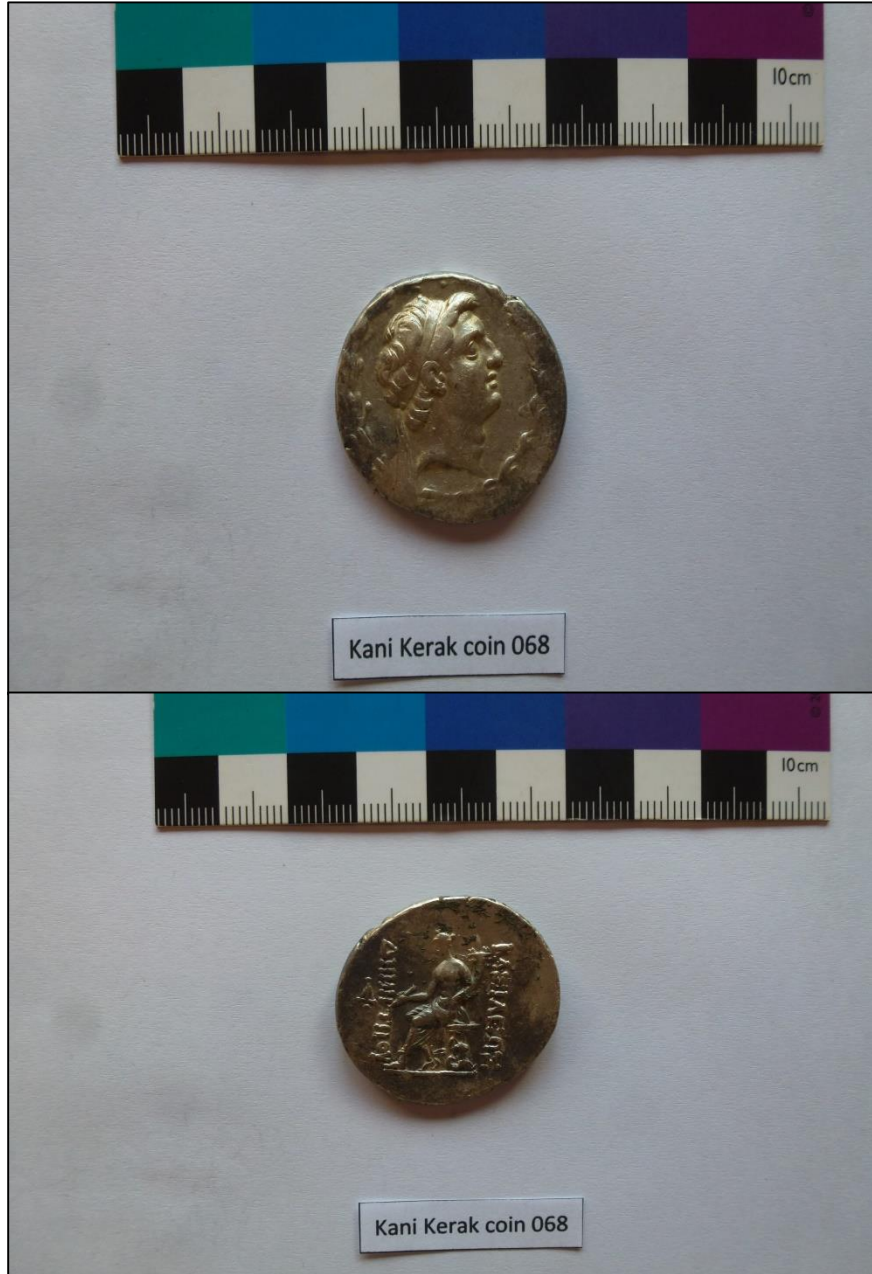
الشكل ٣-أ : مسكوكة فضية من كنز سريشمة تعود الى الملك ديميثريوس، من دون لقب سوتر.