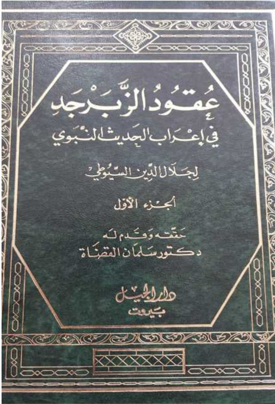
صفحة العنوان من مطبوعة (عقود الزبرجد في إعراب الحديث النبوي)