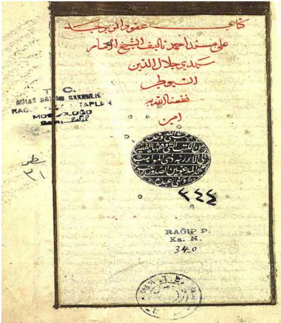
صفحة العنوان من مخطوطة مكتبة راغب باشا لكتاب (عقود الزبير في إعراب الحديث النبوي)