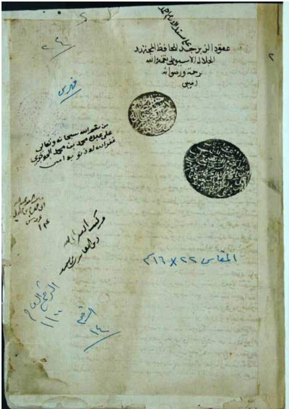
صفحة العنوان من مخطوطة مكتبة الحرم المكي لكتاب (عقود الزبير جد في إعراب الحديث النبوي)