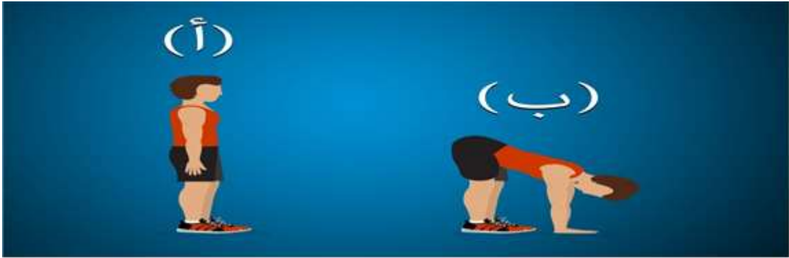
الشكل (٨) يوضح اختبار ثني الجذع إلى الأمام والاسفل من الوقوف