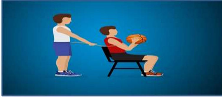
الشكل (٤) يوضح اختبار رمي الكرة الطبية من الجلوس على كرسي

مواصفات اداء : يجلس المختبر على الكرسي والظهر مستقيماً ويتم مسك الكرة الطبية باليدين امام الصدر واسفل الذقن ، ثم يتم ربط المختبر بالحبل حول صدره ويمسك من خلف الكرسي وذلك لمنع حركة الجسم إلى الأمام مع الكرة ، ثم يقوم المختبر برمي الكرة إلى الأمام باليدين ومن امام الصدر . "شروط الاختبار : لكل مختبر محاولتين تحتسب المحاولة الافضل ." "التسجيل : تسجل المسافة التي تقطعها الكرة في اتجاه امام الكرسي لأفضل المحاولتين وتسجل المسافة لأقرب سنتيمتر . (الجنابي، ٢٠١٩، ١٨٦)