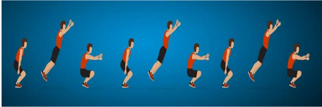
الشكل (١) اختبار الثلاث وثبات إلى الأمام بالقدمين معاً

التسجيل : تسجل للمختبر المسافة التي يثبها ابتداءً من الحافة الداخلية لخط الارتقاء حتى آخر اثر للمختبر بعد الوثبة الثالثة على ان يتم القياس عمودياً على خط الارتقاء . (الجنابي، ٢٠١٩، ١٧٦)