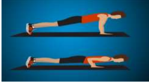
الشكل (٢) يوضح اختبار تثني ومد الذراعين (شناو)

التسجيل : تسجل للمختبر عدد مرات اداء التثني والمد خلال ١٠ ثوانٍ (الجنابي، ٢٠١٩، ١٧٨)