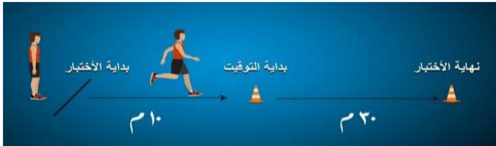
الشكل (٥) يوضح اختبار السرعة الانتقالية القصوى

التسجيل : يسجل للمختبر الزمن الذي استغرقه في قطع مسافة (٣٠م) (من الخط الثاني حتى الخط الثالث) ولأقرب جزء من الثانية . (الجنابي، ٢٠١٩، ١٨٨)