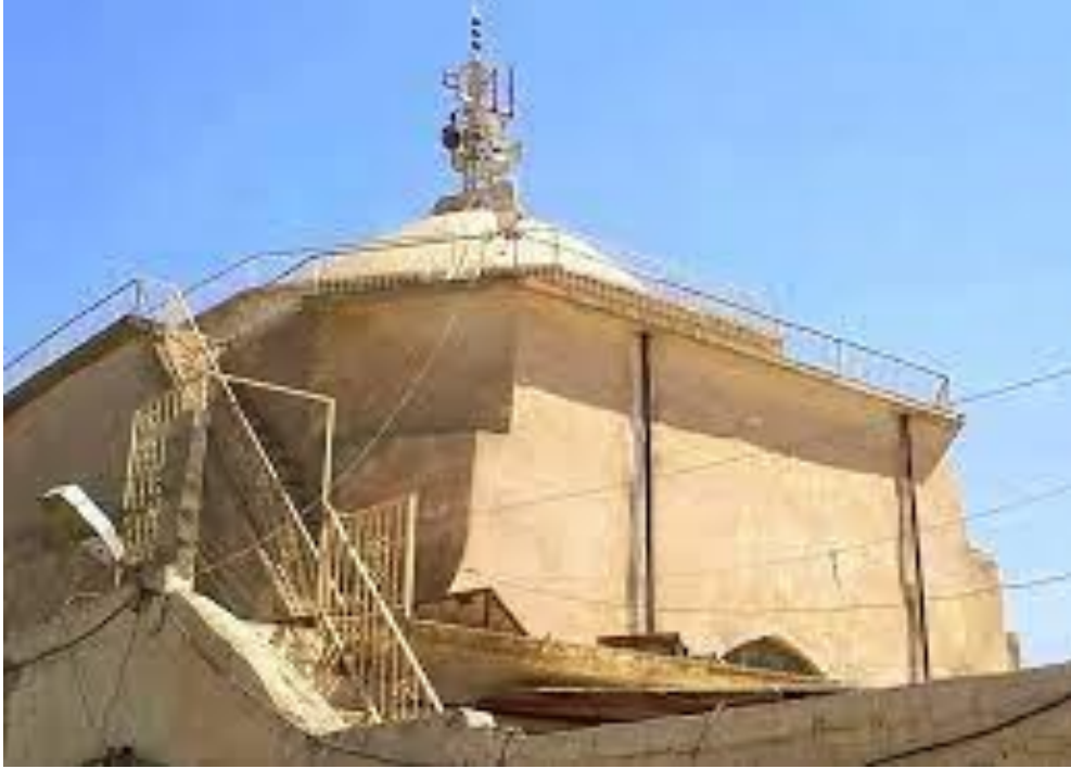
صورة (٢) مدرسة شيخ الشط في بدايات القرن العشرين (المدرسة الكمالية سابقا)