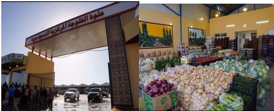
التقطت الصورة بتاريخ ٢٠/٤/٢٠٢١