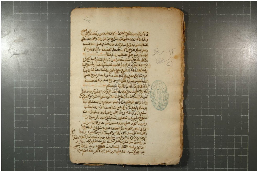
الصفحة الأخيرة من النسخة (أ)