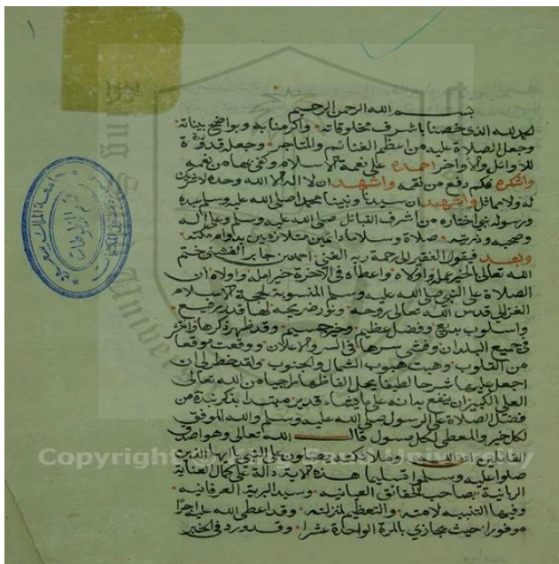
الصفحة الأولى من النسخة (ب)