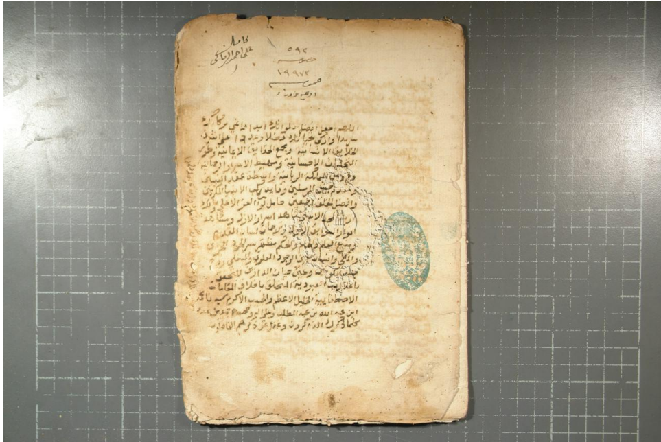
الصفحة الأولى من النسخة (أ)