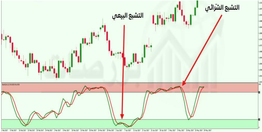
الشكل (١): طريقة عمل مؤشر الستوكاستيك

فيها، مما يتسبب بانخفاض الأسعار (Abo al-teef، ٢٠١١، ٥٠)، وهنا يسهم مؤشر الستوكاستيك في إعطاء إشارة للمستثمرين الذين يستخدمونه لاتخاذ قرار استثماري معاكس للمستثمرين الحاليين في سوق الأسهم، ما يسهم في تحقيق أرباح في حالتي البيع والشراء والعكس صحيح في حالة مرور سوق الأسهم بحالة بيع مبالغ فيها. (Interview، ٢٠١٣، ١٨٥)