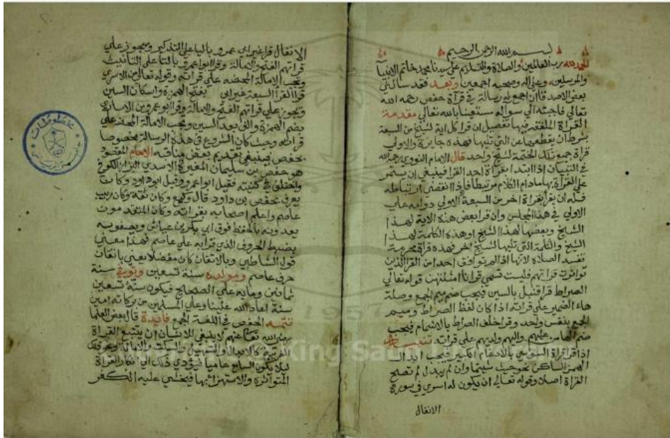
الصفحة الاولى من النسخة (أ)