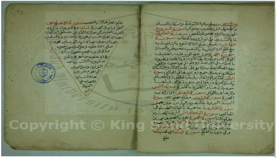
الصفحة الاخيرة من النسخة (أ)