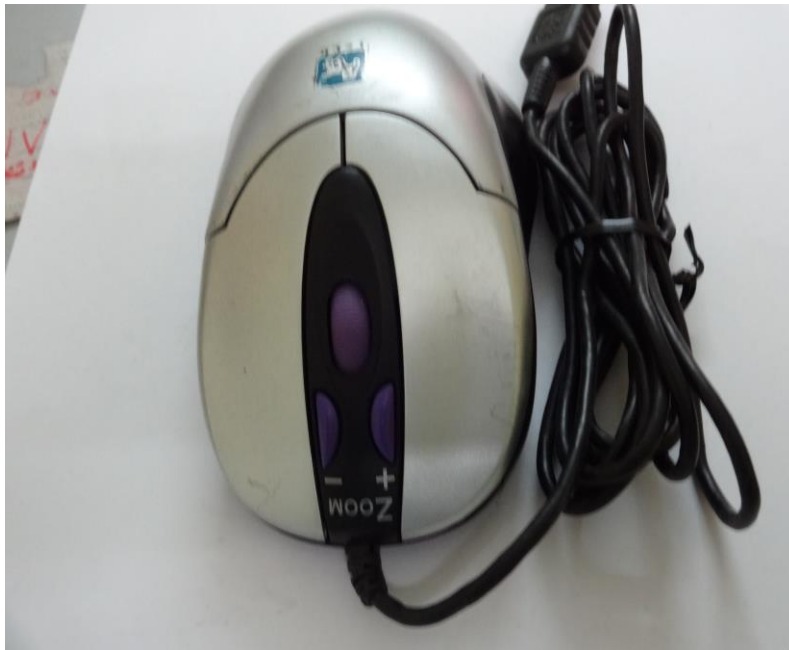
الشكل ( ١ )