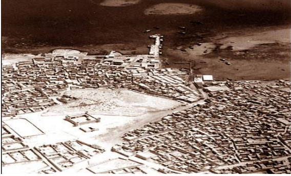
شكل (1) صورة جوية لمدينة الدوحة عام 1947

(3) النسيج العمراني الحديث لمدينة الدوحة: أدت السياسات التصميمية الحديثة إلى تشجيع الزحف بالاتجاه الشمالي والغربي من المدينة من خلال تقنيات التسهيلات الحضرية الحديثة، وتطوير المناطق التجارية الحديثة، وإنشاء مراكز فيها. وشمل قلب المدينة معظم الفعاليات التجارية في مبانٍ متعددة الطوابق ذات توسع عمودي مفرط ضمن مركز المدينة الحديث، وإعادة تسقيط الأبنية الإدارية في المدينة. في حين تلاشى النسيج الحضري للمدينة القديمة واستبدل بتخطيط هندسي وأصبحت وسائل النقل مقياسه الأساس في التكوين المستحدث.