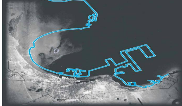
شكل(2) صورة جوية لمدينة الدوحة عام 1971

Innovation Center for Design and Technology, Qatar National Council for Arts and Culture, 2003,