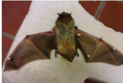
صورة (1): توضح الخفاش بعد التخدير والتثبيت لغرض التشريح

أما فيما يتعلق بالدم فقد عملت مسحات دموية لكل عينة وصبغت بواسطة صبغة كمزة، ثم فحصت الشرائح بواسطة المجهر الضوئي بحثاً عن الطفيليات الدموية.